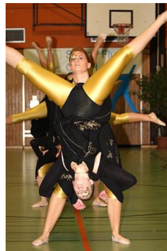
La Alegria, TSV Künzelsau