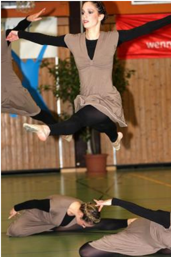
Contract Release, TSG Öhringen