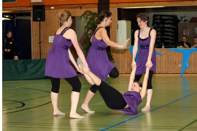
young fire, SV Sindelbachtal

durchgeführt. Diese Entscheidung trifft das Fachgebiet in Absprache mit der STB-Geschäftsstelle nach Meldeschluss. Die für diesen Wettkampf Gemeldeten werden über die Veränderungen vor dem Wettkampf unterrichtet. Findet ein Rahmenwettkampf statt, bekommen die Teilnehmer eine Urkunde, aber keine sonstige Auszeichnung.