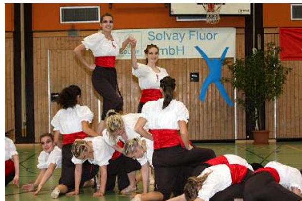
Jazz-Bandits, TSG Söflingen