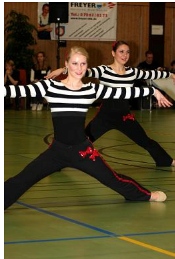
EviDance, TSV Ingelfingen