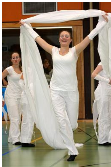
salta dea, TSV Künzelsau