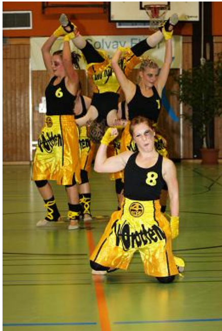
Vorboten, TV Conweiler