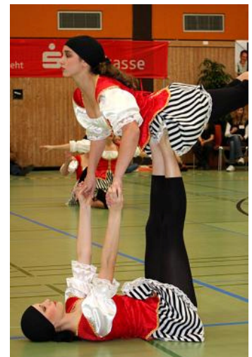
out of control, TSV Ingelfingen