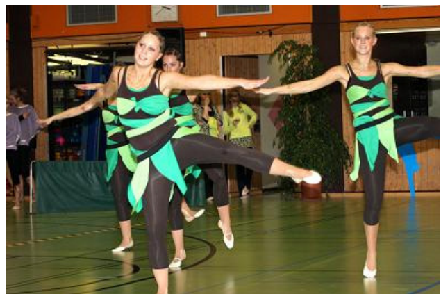
Starlets, SC Korb