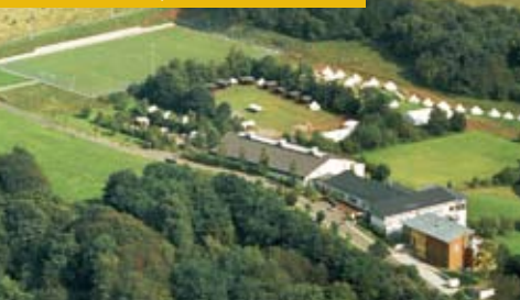
Trappenkamp, Nähe Nordsee