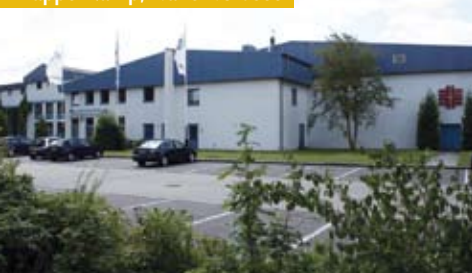
Bartholomä, Schwäbische Alb